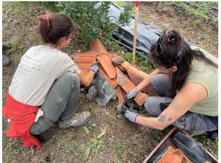
Création de pierriers à partir de tuiles canal et d'ardoises

Nous avons créé dix abris en tuiles et ardoises de récupération à l'attention des reptiles qui pourront venir s'y chauffer au printemps ou s'y cacher, tout comme les petits mustélidés tels que la belette ou l'hermine. Pour les serpents, deux plaques reptiles de couleur noire ont été placées au sol, bien orientées au sud pour leur offrir une plaque chauffante en début de saison et les attirer vers les galeries de campagnols, petits rongeurs présents dans les cultures. Pour compléter, quatre perchoirs à rapaces nocturnes ont été insérés directement dans les cultures.