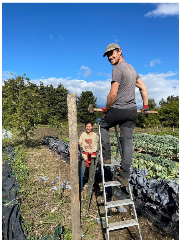
Pose d'un perchoir à rapaces dans les cultures