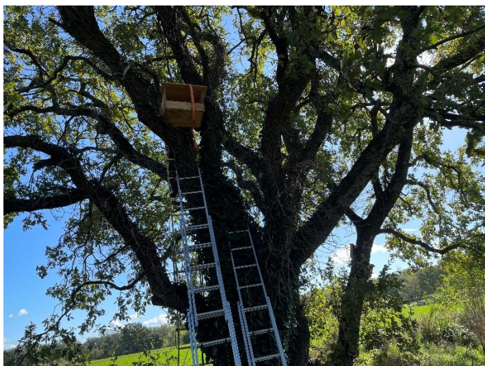
Pose d'un nichoir à faucon crécerelle dans un grand chêne