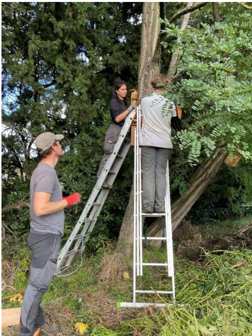
Pose de gîtes à chauves-souris en immeuble dans un robinier

Ce projet a été possible grâce au soutien financier d'une généreuse donatrice qui souhaite rester anonyme et que nous remercions ici chaleureusement pour son engagement envers la biodiversité.